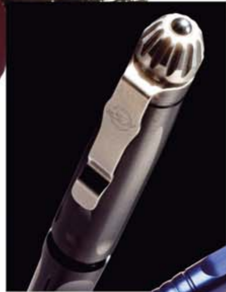
Edelkugelschreiber mit Zusatznutzen: Der SureFire Pen I besticht durch ein hübsches Design sowie durch Trageclip und Glasbrecher. Mittlerweile gibt es schon ein weiteres Modell Pen II, das mit einem Preis von 99 Euro auch noch günstiger ist.