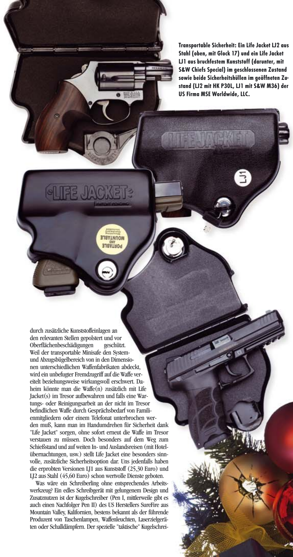
Transportable Sicherheit: Ein Life Jacket LJ2 aus Stahl (oben, mit Glock 17) und ein Life Jacket LJ1 aus bruchfestem Kunststoff (darunter, mit S&W Chiefs Special) im geschlossenen Zustand sowie beide Sicherheitshüllen im geöffneten Zustand (LJ2 mit HK P30L, LJ1 mit S&W M36) der US Firma MSE Worldwide, LLC.

sättlich zu sein. Gerade wir Legalwaffenbesitzer (IWB) werden mit völlig überzogenen Gesetzen rund um die sichere Aufbewahrung derzeit drangsalariert. Dabei besitzt natürlich jeder verantwortungsvolle Waffenfreund bereits einen Waffentresor der entsprechenden, gesetzeskonformen Schutzklasse, nahezu alle modernen Waffen werden direkt mit integrierten Kindersicherungssystemen produziert und/oder mit üblichen Sicherheitsschlössern ausgeliefert und jeder ambitionierte IWB handelt auch in den eigenen vier Wänden, beim Transport und auf dem Schießstand gemäß den zahlreichen Gesetzes- oder Verwaltungsvorschriften. Nichts desto trotz könnte der Sicherheitsbehälter "Life Jacket" der US Firma MSE Worldwide, LLC aus Fort Worth, Texas, eine weitere, praktische Zusatzversicherung für den einen oder anderen Leser darstellen. Zumal diese simple Alternative sicherlich günstiger ist als die von der Politik und Industrie hoch gelobten biometrischen Sicherheitssysteme. Die kompakte, mittels Schlüssel abschließbare Sicherheitshülle "Life Jacket" für entladene, nicht feuerbereite Kurz- oder auch Langwaffen gibt es in einer Ausführung aus bruchfestem Polycarbonat-Kunststoff oder aus Stahl. Die Waffe wird bei der Lagerung im "Life Jacket" durch eine Schaumstoffeinlage und bei der LJ2 Stahlversion