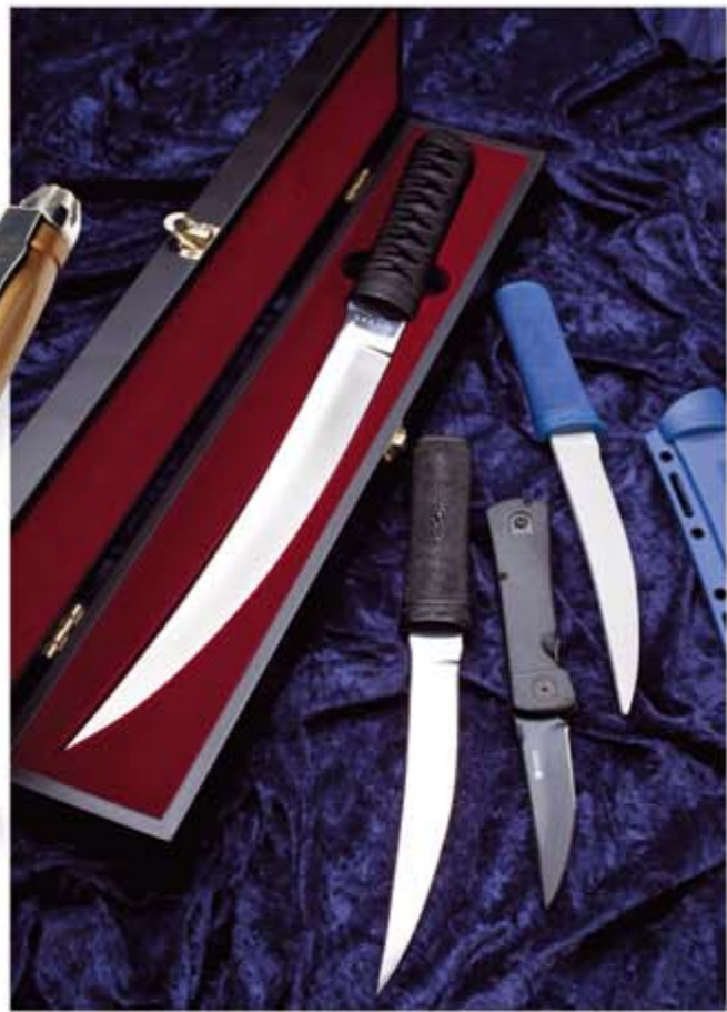
Scharfes Konzept von James Williams: Neben dem brandneuen, gigantischen Hisshou mit 33 cm langer Klinge (links in Holzkassette) hat der Nahkampfspezialist für CRKT bereits das führigere, fest stehende Messer Hisstasu (109,99 Euro, als blaue und stumpfe Trainingsversion 69,90 Euro) sowie die Klappmesserversion des Hisstasu (99,90 Euro) entwickelt.

aufgrund des speziellen Gewebes wirklich federleicht und sehr komfortabel zu tragen. Zu den Details gehören beispielsweise eine um bis zu 10 cm flexible Bundweite, die doppelte Materialstärke im Gesäß- und Kniebereich, ein inneres Kunststoffband, das hilft, das Hemd an seinem Platz zu halten (was wiederum den Zugriff auf Ausrüstungsgegenstände am Gürtel erleichtert), zwei mittels Magneten verschließbare Gesäßtaschen sowie eine leicht zugängliche Doppeltasche auf der linken Beinseite für die Unterbringung eines Mobiltelefons oder anderer Utensilien. Natürlich besitzt die TNT verstärkte, besonders breite Gürtelschlaufen. Fairer Preis: 64,95 Euro.